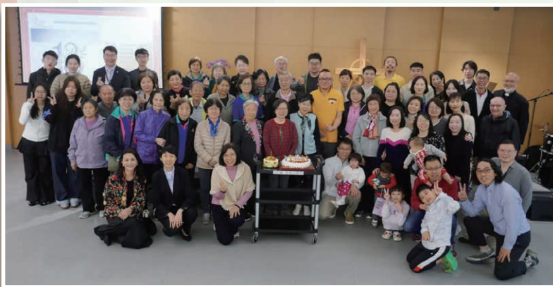
普通話團契十三週年感恩崇拜後大合照（2025年3月1日）

普通話團契一直致力成為一個「家」：讓旅者在旅程中有棲息之處，讓遊子在外有家可回，認識上帝更深，成為祂喜悅的器皿，歸榮耀於上帝！