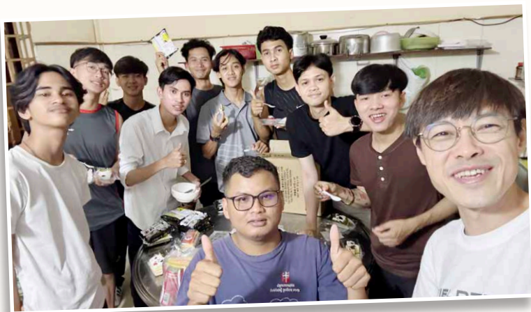
筆者（右一）在衛理公會男宿舍與學生一起生活

作為海外宣教士必須學習當地語言，我害怕說外語。柬埔寨人母語是高棉語，我懂說的就只有「你好」和「1, 2, 3」。幸好我入住的宿舍有十多位年輕人，大部分能以簡單英語溝通，甚至有懂華語的；每天早上六時一起讀經靈修，晚上九時敬拜查經；有機會一同吃飯時，聆聽他們生活和信仰的經歷，建立靈裏關係和禱告。另外，在榮耀堂的小學生班組教英文及中文（即英語及華語），課堂以外則借助翻譯程式及身體語言來溝通。在崇拜證道，雖然宣教士可安排翻譯，但我以信心交上，讓聖靈帶領，最後用華語與華人羣體分享。我體會到「以心交流，突破界限」，在基督的愛裏就能看見一份有溫度的關係。