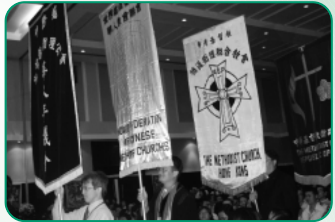
各地區代表高舉錦旗列隊前進，右二為本會的旗幟