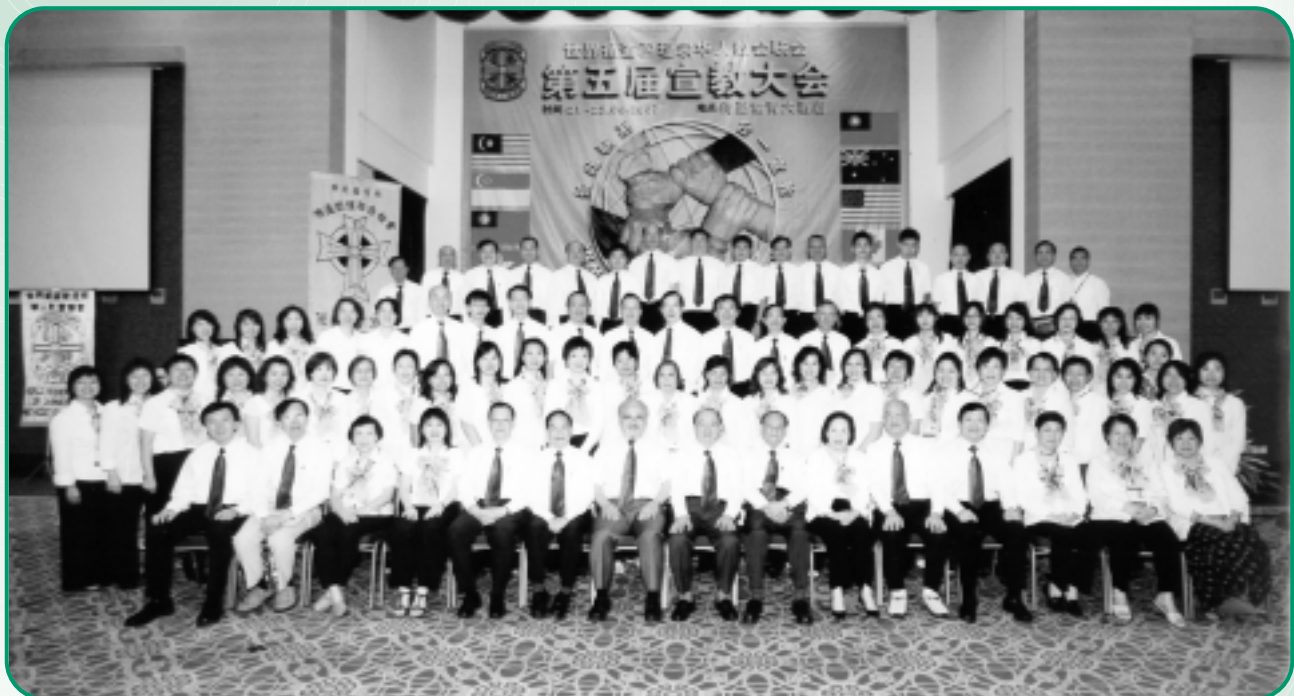
本會全體與會者合照