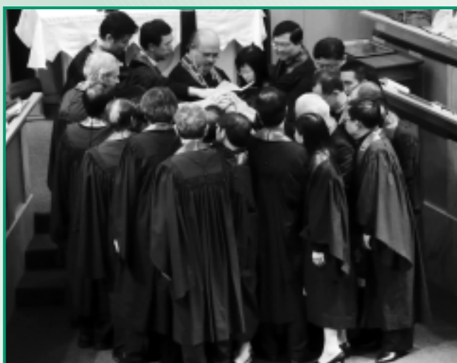
本會全體牧師別分別為兩位會吏主持按手禮