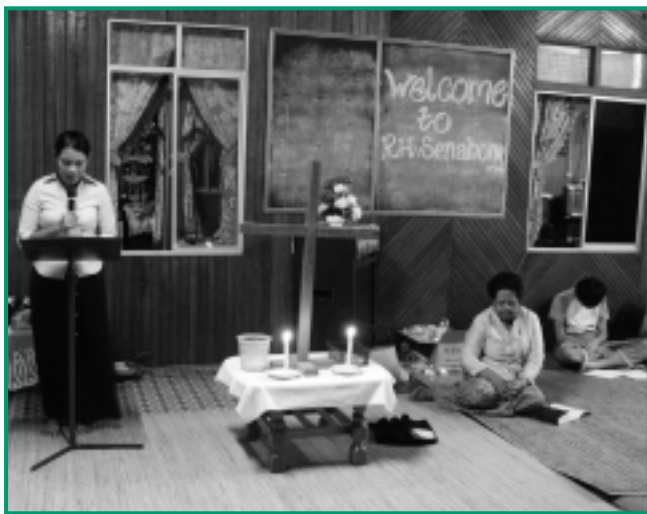
於伊班族長屋內的聚會情況

執筆至此，心繫一羣宣教士的生活、工作與安危，願將他們都交在主手中，求主賜他們平安、健康、智慧與能力。更求主教導我們懂得如何彼此聯繫，合一宣教。阿們。