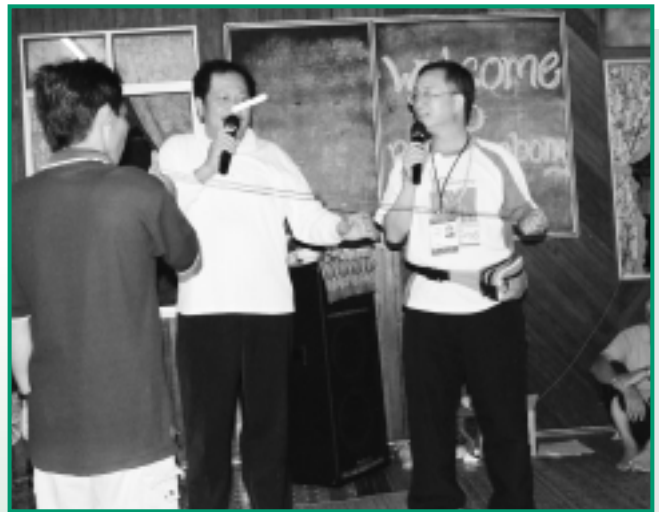
范牧師（右一）表演福音魔術