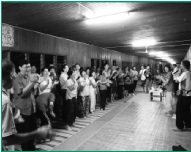
香港地區代表愛心獻唱

如有可能，盼望這點小小的反省能夠成為我們繼續努力宣教的動力和提醒，也成為我們參加第六屆華宣大會時需要留意的地方，正如使徒保羅所提醒的那樣：「務要傳道，無論得時不得時，總要專心，並用百般的忍耐，各樣的教訓，責備人，警誡人，勸勉人。」（提後四：2）