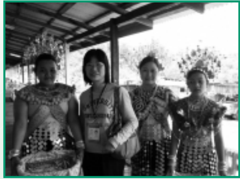
本文作者(左二)與穿着傳統服裝的伊班族婦女合照

終於來到了目的地，一個小小的流水溪澗，既不雄偉也不壯觀，但卻是我快樂的源頭，使我感受到為何宣教士會在惡劣的宣教環境中還滿有喜樂，因為他們的快樂是有目標的——就是為神作工，順着聖靈撒種的，必從聖靈收永生。世俗人把快樂建築在眼目情慾上，更甚者是追求官能刺激，如吸毒、賭博及濫交，只有愈快樂愈墮落！因為他們沒有正確的目標，生命失去了方向。