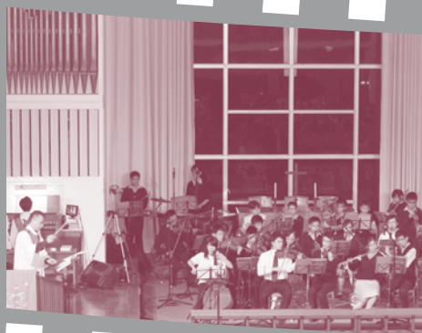
▲ 沙田循道衛理中學管弦樂團