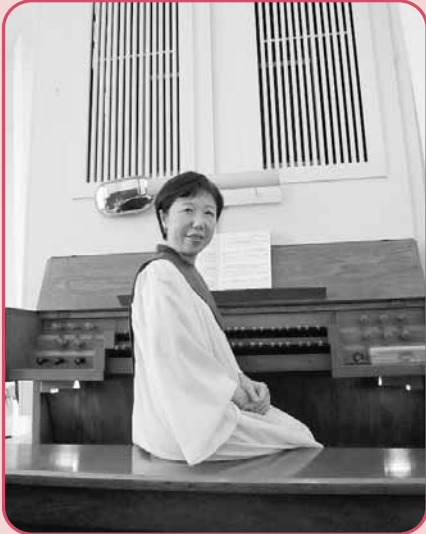
攝於九龍堂之管風琴鍵盤前