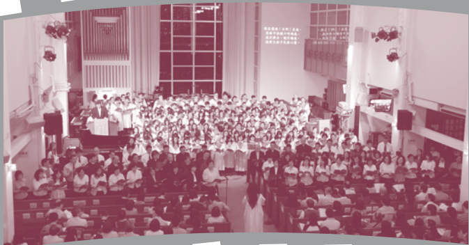
▲ 全體詩班及宣教同工聯合詩班