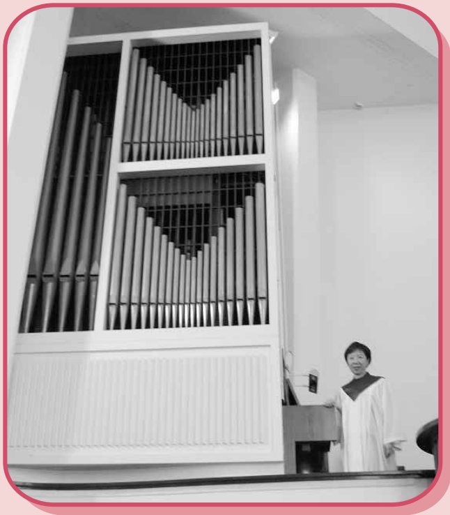
本會九龍堂之管風琴琴管

管風琴，電子琴以發音震盪器發聲，盡量模仿管風琴的音色。不過，管風琴與電子風琴就如鮮花與假花相比，管風琴就如鮮花般帶有生命力。有外國的風琴師視電子風琴為玩具而已。管風琴如果保養合宜，可用上數百年，電子琴的壽命可能只有二十年左右。