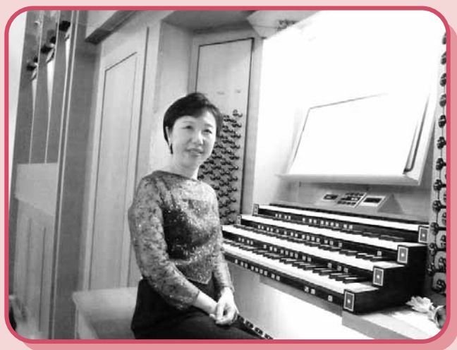
攝於二〇〇九年九月文化中心風琴獨奏會

黃：目前世界上最大的管風琴是在美國新澤西州大西洋城的大會議廳內，該琴有七層手鍵盤，一千二百五十個音色栓。