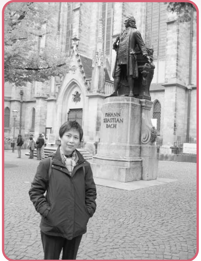
作者去年在德國來比錫聖多馬教堂外巴哈像前留影。巴哈在此擔任樂師廿八年

稱頌上帝大能的拯救是會眾詩歌一個重要的主題。哈拿的禱告詩（撒下二：1-10），大衛頌讚之歌（代上十六：8-36），以賽亞感恩之歌（賽十二：1-6），馬利亞的尊主頌（路一：46-55），撒迦利亞的預言詩（路一：68-79）等，都是信徒熟悉的救恩詩歌。不少在崇拜中頌唱的詩歌，如：「榮耀歸於真神」、「奇妙恩典」、「怎能如此」、「堅固保障」等 1 ，也是歷世歷代信徒經歷上帝拯救的恩典後，以頌揚上帝的救恩為題材而寫成的。這些詩歌雖然出自不同的時代、地域，但所傳述的都是上帝救贖的故事，亦是今日我們所經歷的故事，因此今天我們能藉着詩歌，加入歷代信徒的頌唱行列，與他們一同和應。