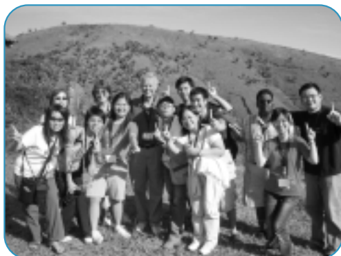
雖然大家要各自分散，繼續「上路」，但那份不分國界，不分種族和言語的友誼，真是難得。