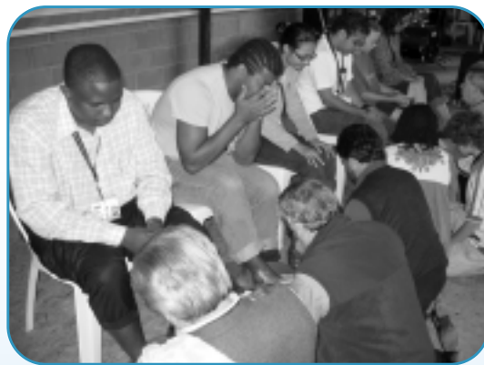
牧者為各門徒代表洗腳，將主耶穌為門徒洗腳之情況活現眼前。

在工作坊所學的「信仰分享」，大部分我都在香港學過了，但在不同國籍之牧者教導下，又刺激我思想上的震盪。我不期然有一個夢想，就是希望有一個來自不同國家的牧者，聚首一堂，在香港甚至在亞洲舉行培靈及佈道會，彼此激勵，在主內融合！