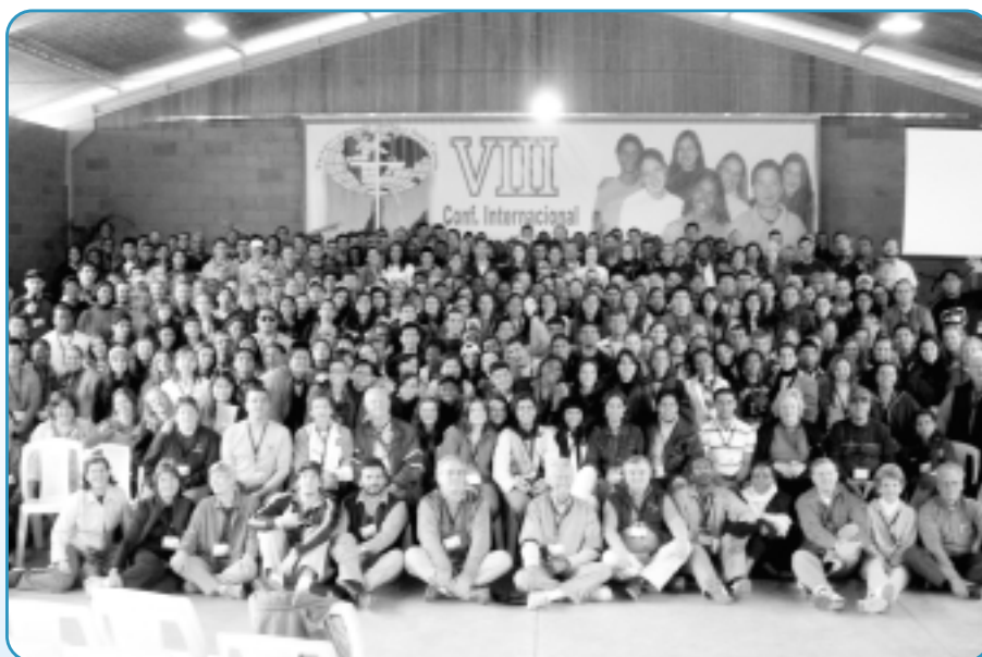
375位來自42個國家的年青人聚集在一起，大家背景各異，有會吏、宣教幹事、神學生、大學教授、工程師、大學生等。