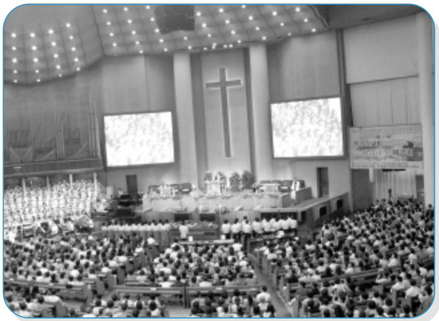
韓國汝矣島純福音教會會堂。

除了愛，我們也體會到信心的重要。在旅程中，我們經歷神的信實，體會到「你們祈求，就給你們；尋找，就尋見；叩門，就給你們開門」（太七：7）的應許。當我們不斷憑信心禱告時，神便為我們開道路。我們很多弟兄姊妹在旅程中得着身體及心靈醫治，就如有一位小朋友因發高燒入了醫院，但當我們同心合意禱告時，看見神大能的手醫治他，第二天他便可與我們一起繼續行