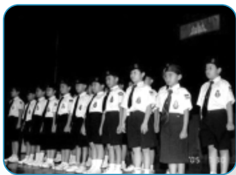
「基督兒童軍」立願禮

感謝上主讓我這個基督徒教育工作者，在柬埔寨金邊的宣教事工中，親身體驗奇妙的教育三合一：在學校的正規教育（formal education）和外展的非正規教育（non-formal education）的兩造中間，教會同工羣體的非形式教育（informal education）——人與人的接觸溝通——成了橋樑，在這彷彿人間煉獄的柬埔寨重塑新天與新地。