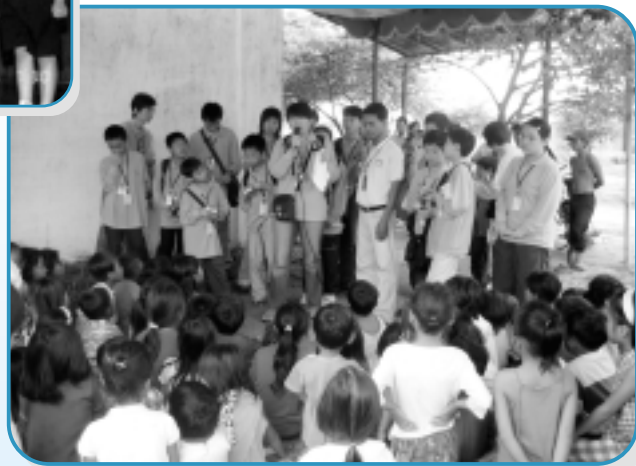
團員於棉芷社區中心外帶領兒童活動