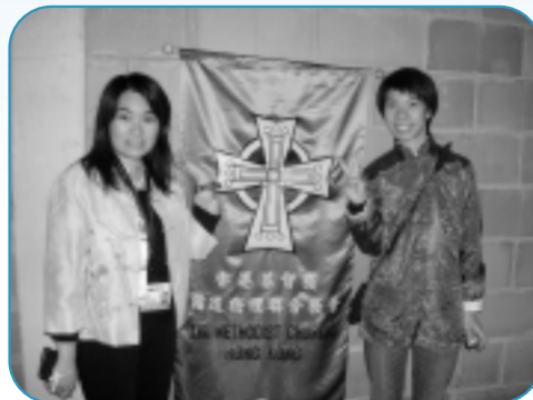
兩位香港代表在開幕禮上穿着民族服飾。

大會的主題是「讓世人都認識耶穌基督」，目的希望循道衛理教會的少年人都能認識「信仰分享」(Faith Sharing)，我亦看到有很多參加者都很願意為主作見證，與其他分享自己的經歷，這一點真令人很鼓舞。但另一方面，我卻留意到我們這羣年輕人除了為主作見證的勇氣外，更需在其他方面有所操練。例如大會安排了不同的屬靈操練項目，但卻不是太受歡迎。我相信要做到最好的「信仰分享」，除了那份熱誠外，亦需要往後不同階段的栽培，好使我們有更豐富的材料來向別人分享。