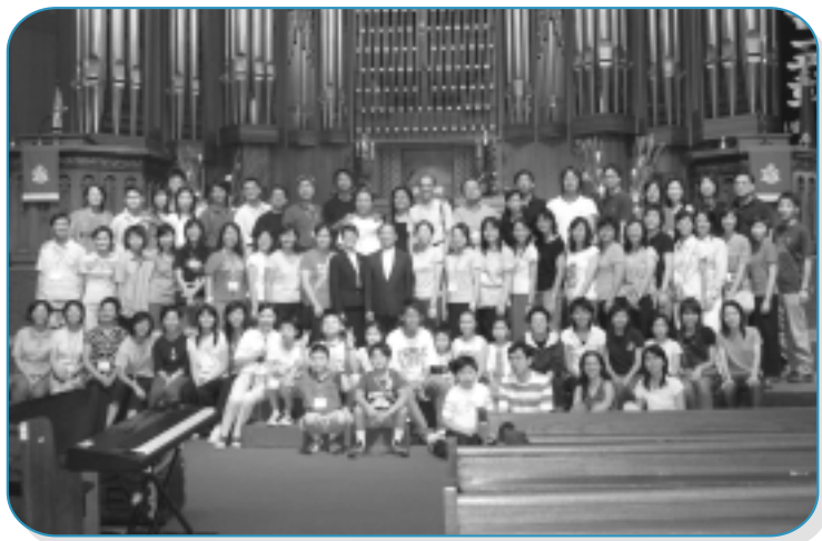
訪韓之旅團友全體照。