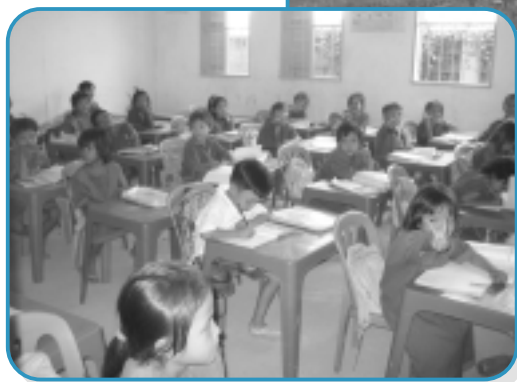
以馬內利小學學生上課情況

感謝上帝！讓我明白到幸福不是必然的；我可以生活在香港有舒適的環境，從小就接受正規的教育，不用為生活而擔憂；亦因着上帝的恩典，有健康的成長，我該怎樣回應上帝呢？「上帝是愛」，我會以上帝的愛，去愛我身邊每一個人，珍惜我所擁有的一切。